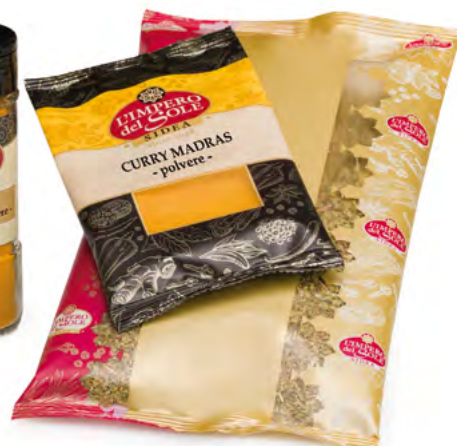
Bustine e pacchi varie grammature