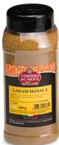
PET 850 cc

Tutti i prodotti sono disponibili in formati diversificati, per ogni esigenza dei vari segmenti del settore Alimentare.