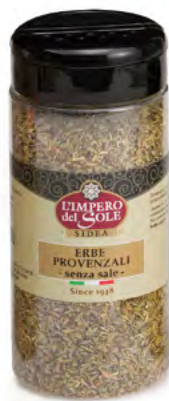
PET 400 cc